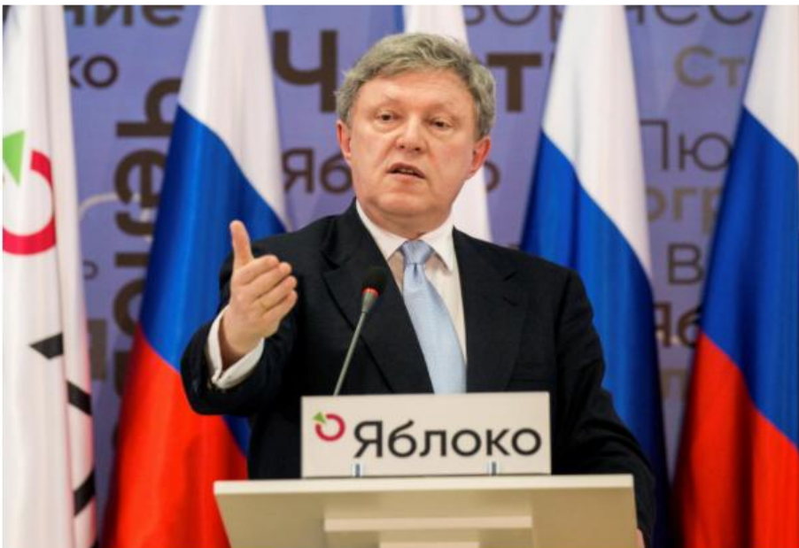
Григорий Явлинский

Сооснователь политической партии «Яблоко» Григорий Явлинский на сегодняшнем ее съезде выдвинут кандидатом в президенты — и несмотря на его низкий рейтинг на момент старта кампании, однопартийцы надеются, что он займет третье место с 10% голосов. Конкурент Явлинского из ЛДПР Владимир Жириновский между тем стал первым, кто подал в Центризбирком документы на выдвижение кандидатом, зарегистрировав своих уполномоченных представителей от партии и получив разрешение на открытие специального избирательного счета.